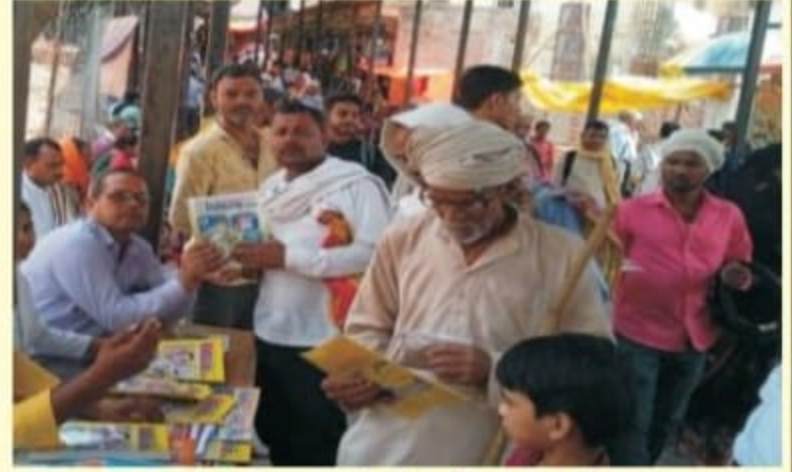
कामदगिरी मार्ग में औषधि और साहित्य का निःशुल्क वितरण