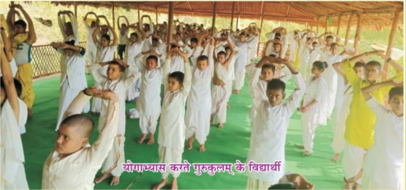
योगाभ्यास करते गुरुकुलम् के विद्यार्थी