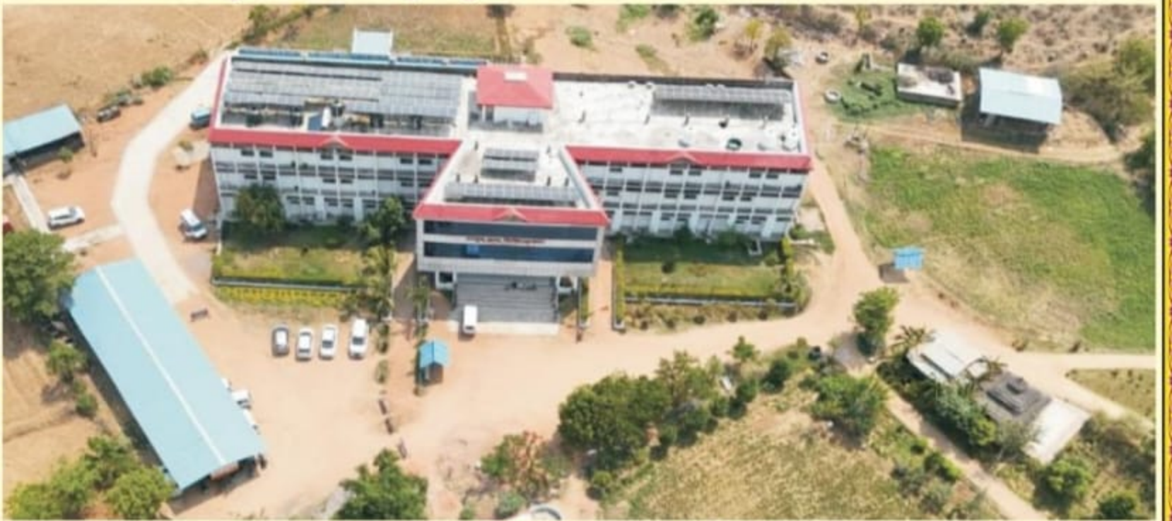
आयुष ग्राम चिकित्सालय का विहंगम दृश्य

स्वामी, प्रकाशक मुद्रक सम्पादक आचार्य डॉ. मदनगोपाल वाजपेयी द्वारा अमेय प्रिंटर्स, स्टेशन रोड बाँदा से मुद्रित होकर आयुष ग्राम (ट्रस्ट) परिसर, सूरजकुण्ड रोड, (आयुष ग्राम मार्ग) चित्रकूट (उ.प्र.) 210205 से प्रकाशित।