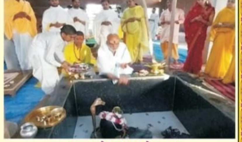
आयुषग्रामेश्वर महादेव का रुद्राभिषेक करते गुरुजी एवं सभी अन्ते:वासी