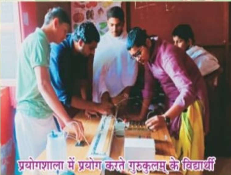
प्रयोगशाला में प्रयोग करते गुरुकुलम् के विद्यार्थी