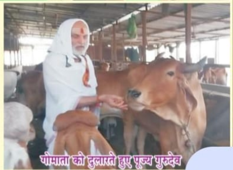
गोमाता को दुलारते हुए पूज्य गुरुदेव