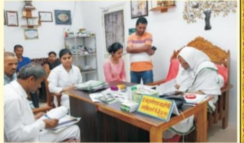
चिकित्सा परामर्श कक्ष का एक दृश्य