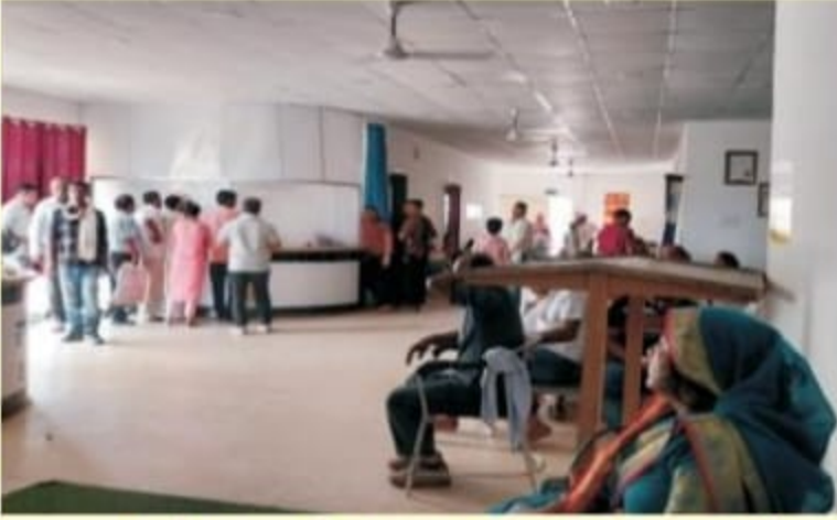
पंजीकरण विभाग एवं प्रतीक्षा कक्ष में रोगियों की भीड़