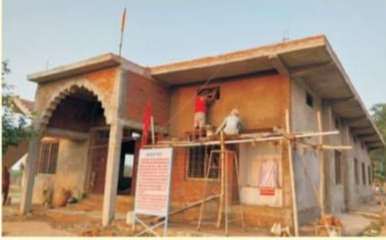
आयुष विहारी राम-सीता और संजीवनी गिरधारी हनुमान जी के मंदिर प्रांगण का निर्माण प्रगति पर